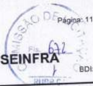
TABELA UNIFICADA SEINFRA