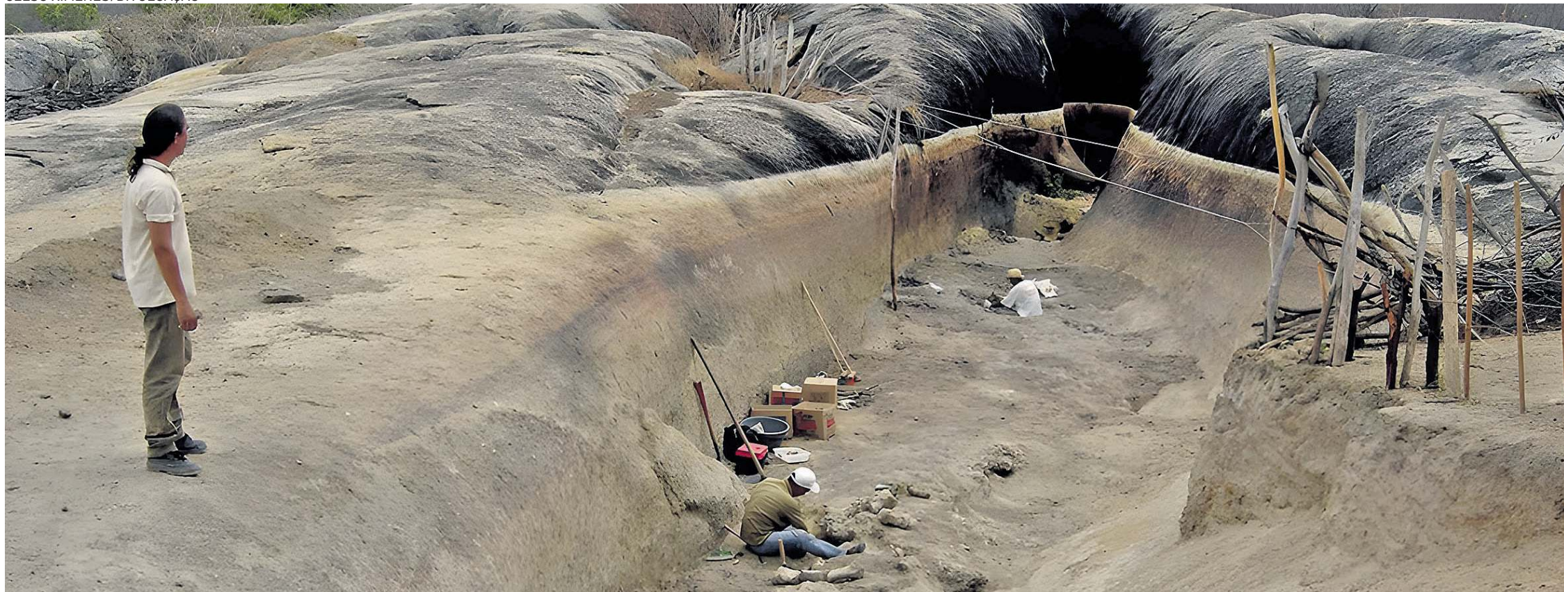
ESCAVAÇÃO fossilífera no sítio paleontológico Jirau, Itapipoca (CE) |